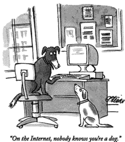
Figure 3: På internettet, ved ingen at du er en hund. Tegning af Peter Steiner, 1993