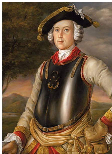
Figure 2: Baron von Münchhausen - tysk adelsmand som underholdte sine gæster med de mest utrolige beretninger fra sit liv.